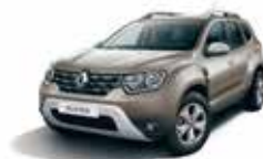
DUNE BEIGE (HNP)