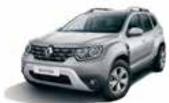
MERCURY GREY (D69)