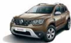
MINK BROWN (CNM)