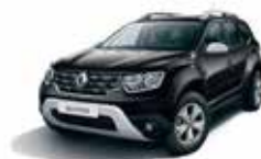
PEARL BLACK (676)