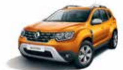
ATACAMA ORANGE (EPY)