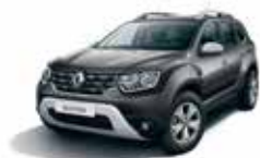
COMET GREY (KNA)