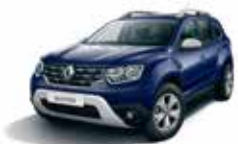
NAVY BLUE (D42)