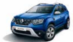
COSMOS BLUE (RPR)