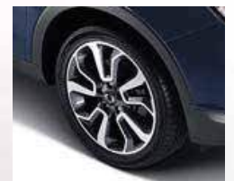
18" Diamond cutting wheels (Silver)

• Two-tone available only in sport 4x2, Elegance 4x2 and Elegance - R 4x2 packages