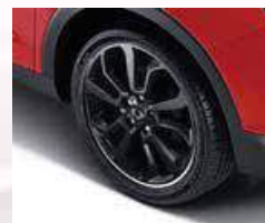
18" Diamond cutting wheels (Black)